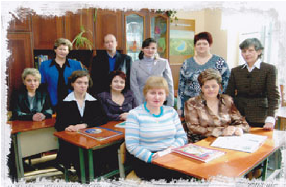
Міжнародний конкурс «Юридична Україна» у Львові. Радяльці з кафедр історії, філософії та права у Львівському національному університеті імені Івана Франка